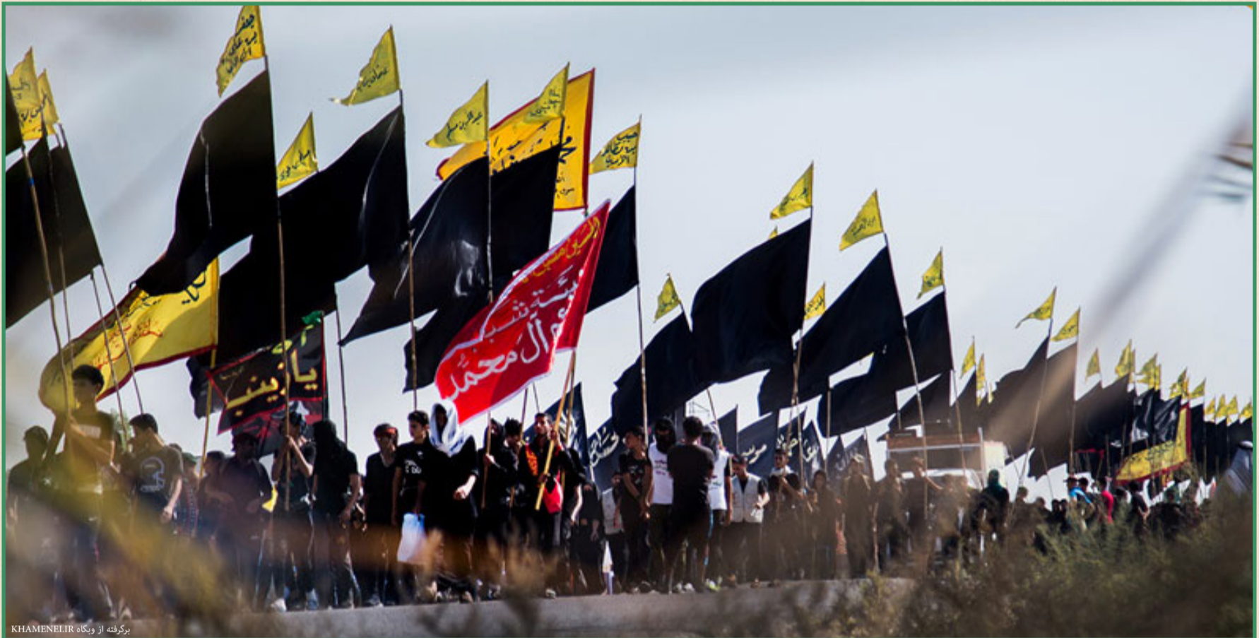
برگرفته از وبگاه KHAMENEI.R