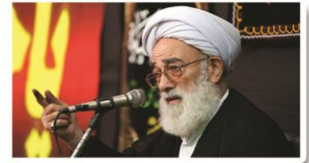
حجت الاسلام و المسلمین نظری منفرد

عضو خبرگان رهبری گفت: عاشورا یک تابلوی هنری انسانی و جذاب است که همه قرآن، دین و ارزش‌های انسانی، دینی، فکری و اخلاقی در آن تجلی پیدا کرده و حاوی همه ارزش‌های الهی است. حداقل ۱۰۰ پیام دین در عاشورا تجلی یافته است.